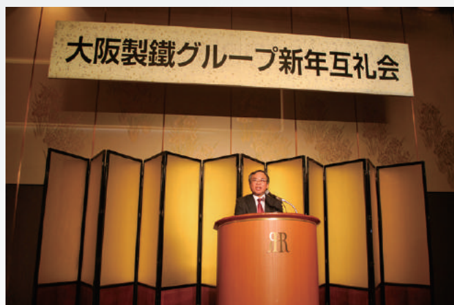
製品ブランド発表の様子