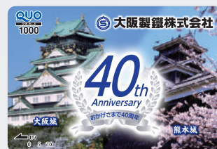
QUOカード (昨年デザイン)