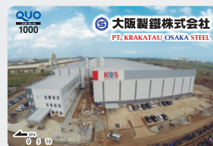
QUOカード (昨年デザイン)